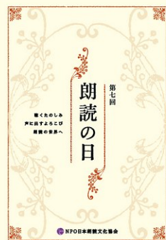
ポスター・チラシ・プログラムデザイン：浅野みどり