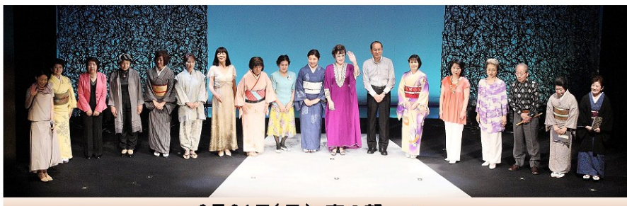
6月21日(日) 夜の部 - D -

公演終了後、出演者、関係スタッフが集まって、打上げの会が博品館劇場ロビーで開かれました。高橋俊三先生の乾杯の音頭のあと、和やかな歓談が続き、2日間に渡る公演は無事終了いたしました。