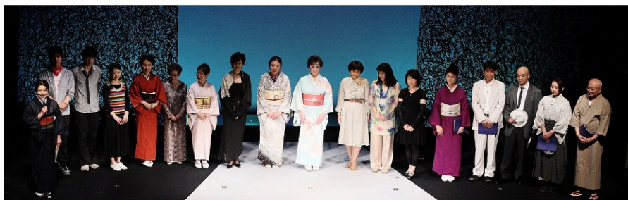
6月20日(土) 夜の部 - B -

出演された皆様、そして裏方、スタッフ、又公演を見に来ていただいたお客様・・・皆の力で「第7回 朗読の日」が無事終了！感謝しています。