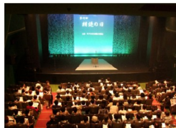
「朗読の日」公演会場内