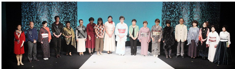
6月20日(土) 昼の部 - A -