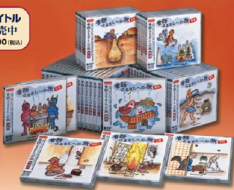
(CD全47タイトル) ■KICG-3181~3227 ジャケット表紙絵:鈴木ひろえ