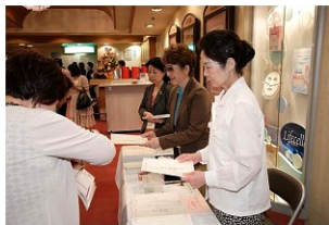
出演者全員が自らも裏方支援をすることが恒例となっています。