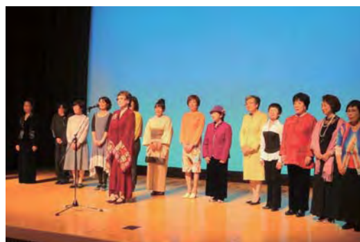
第5回朗読アラカルト