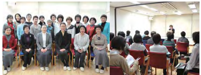
東京カルチャーヴィレッジ・3クラス合同朗読発表会 初めての試みでしたが、各クラスの生徒さんからは相互に朗読が聴けて良かった、緊張したけれど勉強になった、楽しかった、またやってもらいたいとの声が会のあとの懇親会でも上がり、一応の成果は出せたかと私達は安堵致しました。