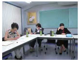
第6回朗読コンクール 予選テープ審査