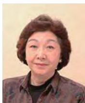
朗読名誉会長 加賀美幸子