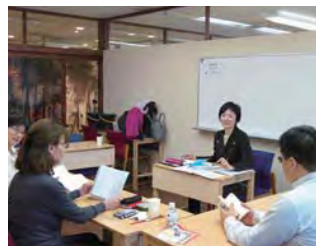
東京カルチャーヴィレッジ