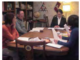
朗読の森 昨年10月スタート第3回目教室風景