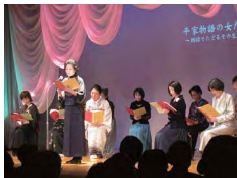
平家物語の女たち