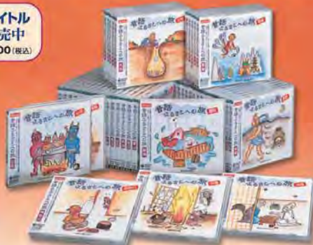
【CD全47タイトル】 ■ KICG-3181~3227 ジャケット表紙絵：鈴木ひろえ