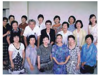
コミュニティアーナ久喜発表会