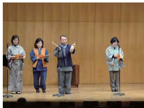
第8回かもめ朗読会