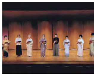
三越カルチャーサロン 源氏物語受講者発表会