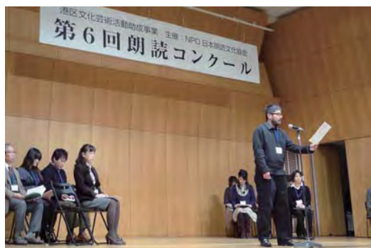
第6回朗読コンクール