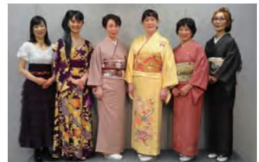
第88回八重洲朗読会