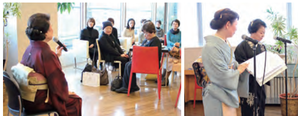
ヒルズサロン朗読会