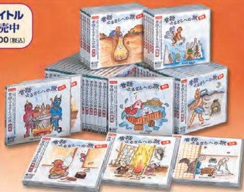
【CD全47タイトル】KICG-3181~3227 ジャケット表紙絵：鈴木ひろえ